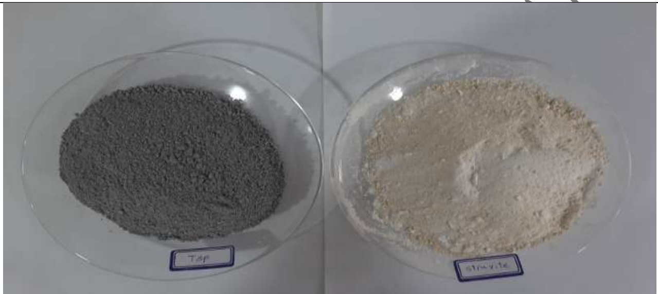
شکل ۱- استروویت (فسفات آمونیوم منیزیم) بازیابی شده از خاکستر لجن فاضلاب و کود فسفر تجاری (سوپرفسفات تریپل) Fig 1. Recovered struvite from sewage sludge ash (magnesium ammonium phosphate) and commercial phosphorus fertilizer (triple superphosphate)