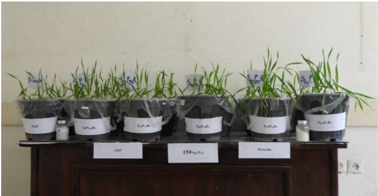
شکل ۲- تاثیر کاربرد سطح ۱۵۰ کیلوگرم در هکتار استروویت بر ارتفاع گیاه گندم Fig 2. The effect of surface application of 150 kg/ha of struvite on height of wheat plant