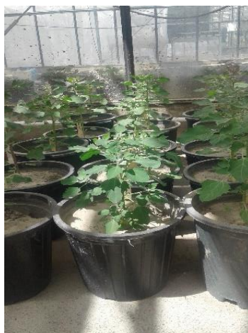
شکل ۲- نمونه‌ای از گیاهان کشت شده در گلدان Figure 2- Sample of planted crops in pots