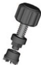
شکل ۲- دستگاه پره برشی