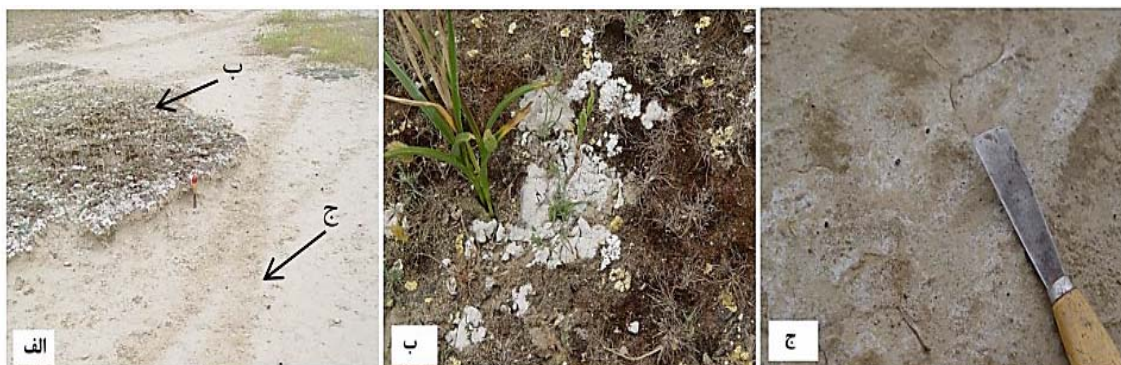
شکل ۲- وضعیت نقاط پوشیده از پوسته‌های زیستی و فاقد آن در مجاورت یک‌دیگر (الف)، وجود پوشش گیاهی در کنار پوسته‌های زیستی (ب)، و حضور نمک در سطح خاک در اثر عدم وجود پوشش در تیمار بدون پوسته (ج)

فرایند تبخیر با حرکت موئینگی مقدار املاح کمتری مجدداً بالا می‌آیند و از آنجایی که در این خاک‌ها سدیم تبادل‌ی مشکل ساز نیست، معمولاً خاک حالت هموار داشته و گذرپذیری نسبت به آب در آنها مناسب است (۱). برخلاف نواحی فاقد پوسته، وجود پوشش گیاهی فراوان در نواحی پوشیده از پوسته‌های زیستی گویای همین امر است که در این قسمت‌ها از لحاظ شوری و وجود املاح به اندازه کافی، شرایط برای رشد گیاهان فراهم است (شکل ۲) و وجود خود این گیاهان آوندی نیز عاملی بر گیاه‌پالائی و کاهش شوری و سدیمی می‌شود. برخلاف سطوح پوششی پوسته‌دار در سطوح بدون پوسته با وجود نفوذپذیری کمتر این املاح در افق اولیه (۵-۰ سانتی‌متری) آن تا حدودی آبشویی شده و در افق پایین‌تر تجمع پیدا نموده است. به علت عدم پوشش گیاهی در سطوح بدون پوسته و در نتیجه تراکم پذیری بیشتر در اثر چرای دام و نفوذپذیری کمتر، املاح به ویژه سدیم امکان آبشویی پیدا نکرده و در نتیجه باعث سدیمی شدن خاک و پراکندگی ذرات شده و بیش از پیش نفوذپذیری را کاهش می‌دهد. همچنین با توجه به وقوع فرسایش در قسمت‌های بدون پوسته می‌توان گفت که هر سال مقداری از خاک سطحی شسته شده و افق-های زیرین که حاوی مقدار زیادی املاح ناشی از تخریب کانی‌های خاک یا آبشویی املاح در طی سالیان گذشته هستند، در سطح خاک ظاهر می‌شوند.