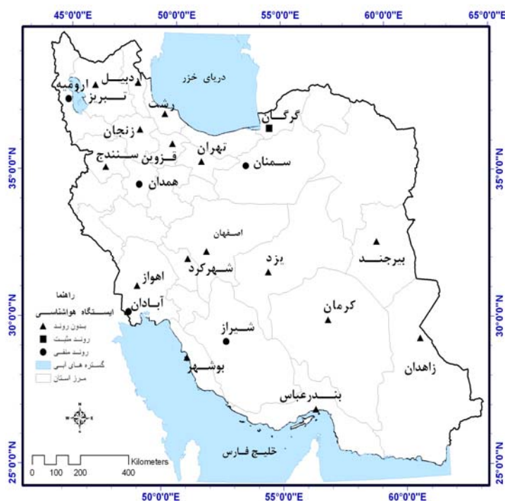
شکل ۱- پراکنش روند در ایستگاه‌های مورد مطالعه در سری زمانی سالانه متغیر نقطه شبیم

نتایج حاصل از بررسی روند متغیرهای مورد مطالعه در سری زمانی سالانه در شکل‌های ۱ و ۲ آمده است.