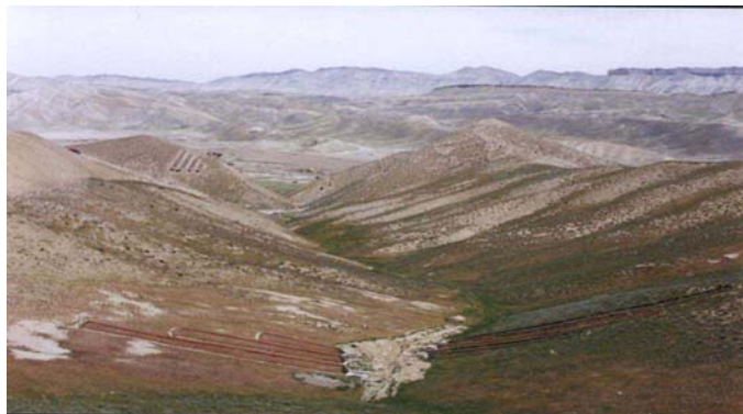
شکل ۲- دور نمایی از محدوده مورد مطالعه

طول کرت‌های آزمایشی در هنگام احداث آنها مد نظر بوده و در هر شیب تعداد ۲ تا ۵ عدد کرت به صورت دسته‌ای با طول ۵، ۱۰، ۱۵، ۲۰ و ۲۵ متر و عرض ۲ متر احداث گردیده است (۳). برای تعیین درجه شیب کرت‌های احداث شده از دوربین نقشه‌برداری (نیوو) استفاده شد. اندازه‌گیری درصد شیب کرت‌های آزمایشی نشان