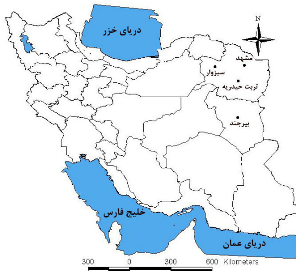
(شکل ۱) - موقعیت منطقه مورد مطالعه

است (۲۱). همین امر سبب شده است که دامنه تغییرات شبانه روزی دما در دنیا کاهش یابد. البته در مقیاس محلی نشان داده شده است که عواملی چون توسعه شهری، آبیاری و بیابان زایی مستقیماً در کاهش دامنه دما موثر بوده اند (۳).