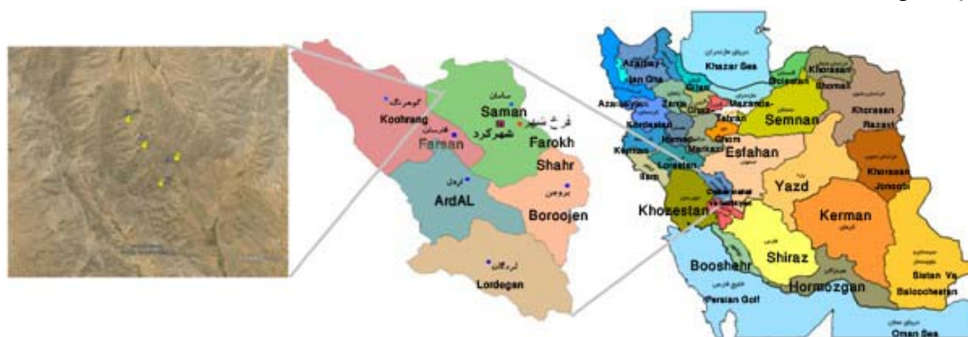
شکل ۱- منطقه مورد مطالعه