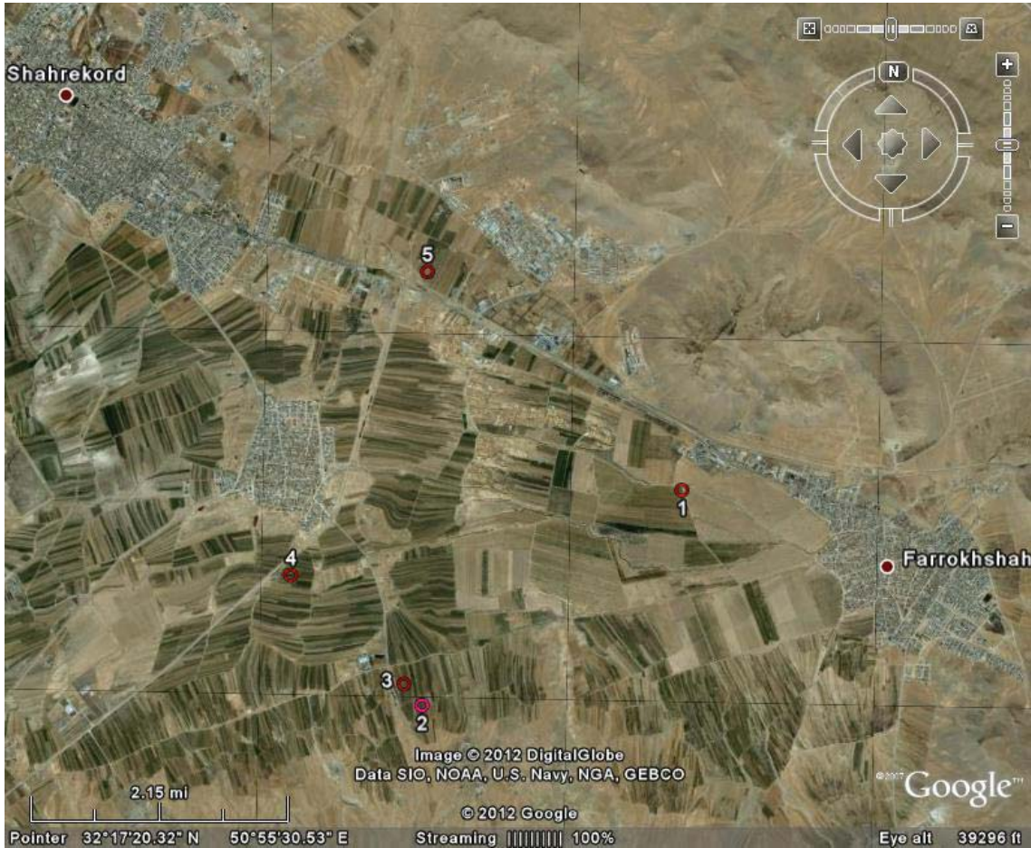
شکل ۱- موقعیت اراضی مورد مطالعه (نقاط ۱ تا ۵) در جنوب شرقی شهرکرد