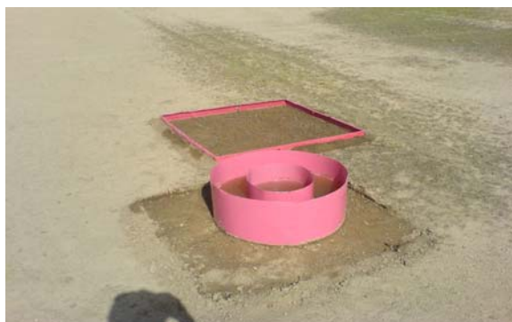
شکل ۲- استوانه‌های مضاعف و پلات ۱ متر مربعی نصب شده در محل تحقیق

ابتدا با اضافه کردن حجم آب به میزان ۵، ۱۰ و ۱۵ لیتر در پلات یک متر مربعی سطح رطوبتی مورد نظر تأمین شد و بعد از ۶۰ دقیقه از استوانه‌های مضاعف به دلیل معمول بودن شیوه و تأمین اطلاعات مفید در صورت کاربرد صحیح (۱۶) جهت اندازه‌گیری نفوذ به صورت شکل ۲ استفاده شد. برای افزایش دقت نتایج، اندازه‌گیری نفوذ در هر یک از تیمارها با چهار تکرار صورت پذیرفت. همچنین برای ایجاد امکان مقایسه و نیز ارزیابی تأثیر تیمارهای مختلف رطوبت اولیه با شرایط معمول، اندازه‌گیری نفوذ خاک بدون رطوبت با تکرار مشابه نیز لحاظ گردید.