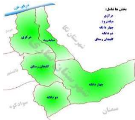
شکل ۱- موقعیت دشت ساری در استان مازندران Figure 1 - Location of Sari Plain in Mazandaran Province